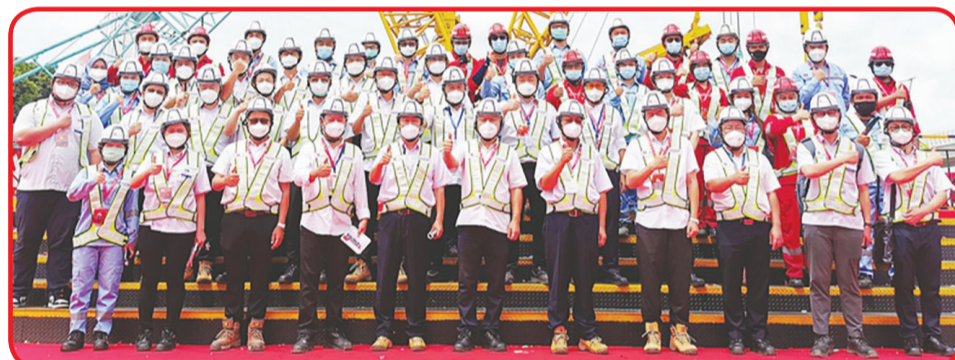
FOTO BERSAMA: Pekerja konstruksi Tiongkok-Indonesia berfoto bersama.