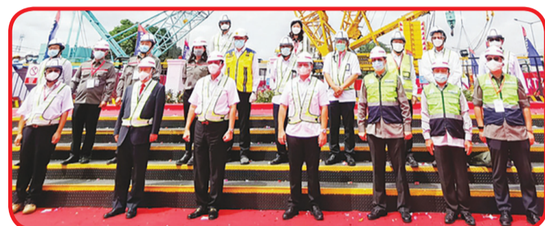
PIMPINAN: Para pimpinan yang hadir dalam acara tersebut berfoto bersama.

Hal ini sangat penting untuk mendorong pembangunan social ekonomi Indonesia, memperdalam kerja sama ekonomi perdagangan Tiongkok-Indonesia serta pertukaran budaya sekaligus meningkatkan pembangunan "Belt and Road". Memiliki makna yang amat penting. • idn/din