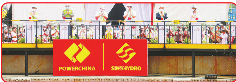
Tunnel 1 Breakthrough Ceremony.

"Saya sangat berharap semua orang dapat menggunakan semangat yang sama untuk berperan di bidangnya masing-