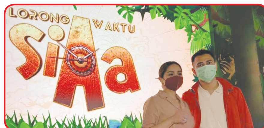
Raffi Ahmad dan Nagita Slavina