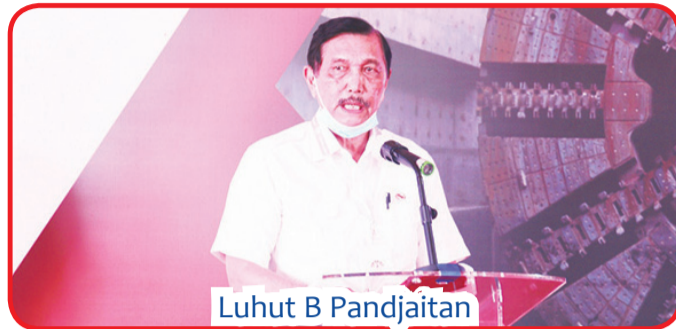
Luhut B Pandjaitan