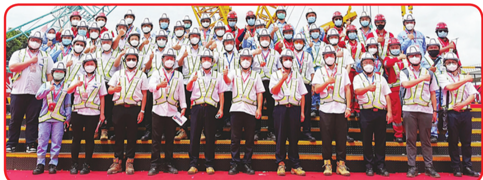
Staf konstruksi yang hadir di lokasi berfoto bersama.