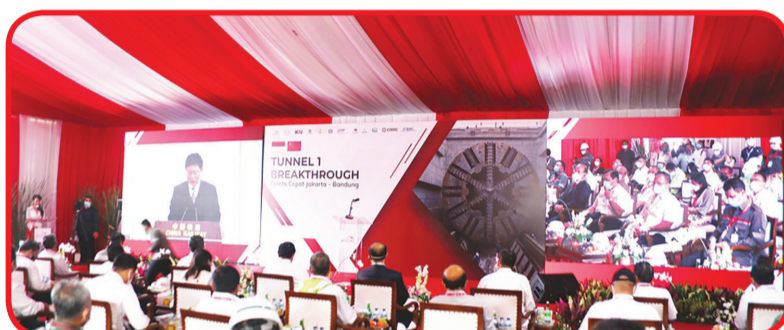
Suasana Tunnel 1 Breakthrough Ceremony.