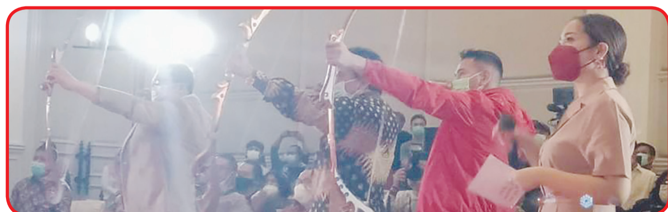
Prosesi peluncuran Lorong di AA

Untuk menguatkan kecintaan generasi muda terhadap NKRI," kata Doli. • bam/kris