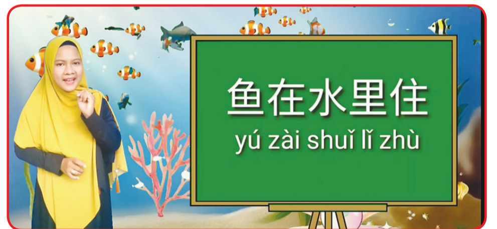
Guru Aisha dari SDS Bina Bhakti Sungai Raya, Kabupaten Kubu Raya meraih juara tiga kompetisi mikro kelas.

Agar mereka dapat mempelajari bahasa Tionghoa dengan kegembiraan di taman hewan yang indah. • idn/din